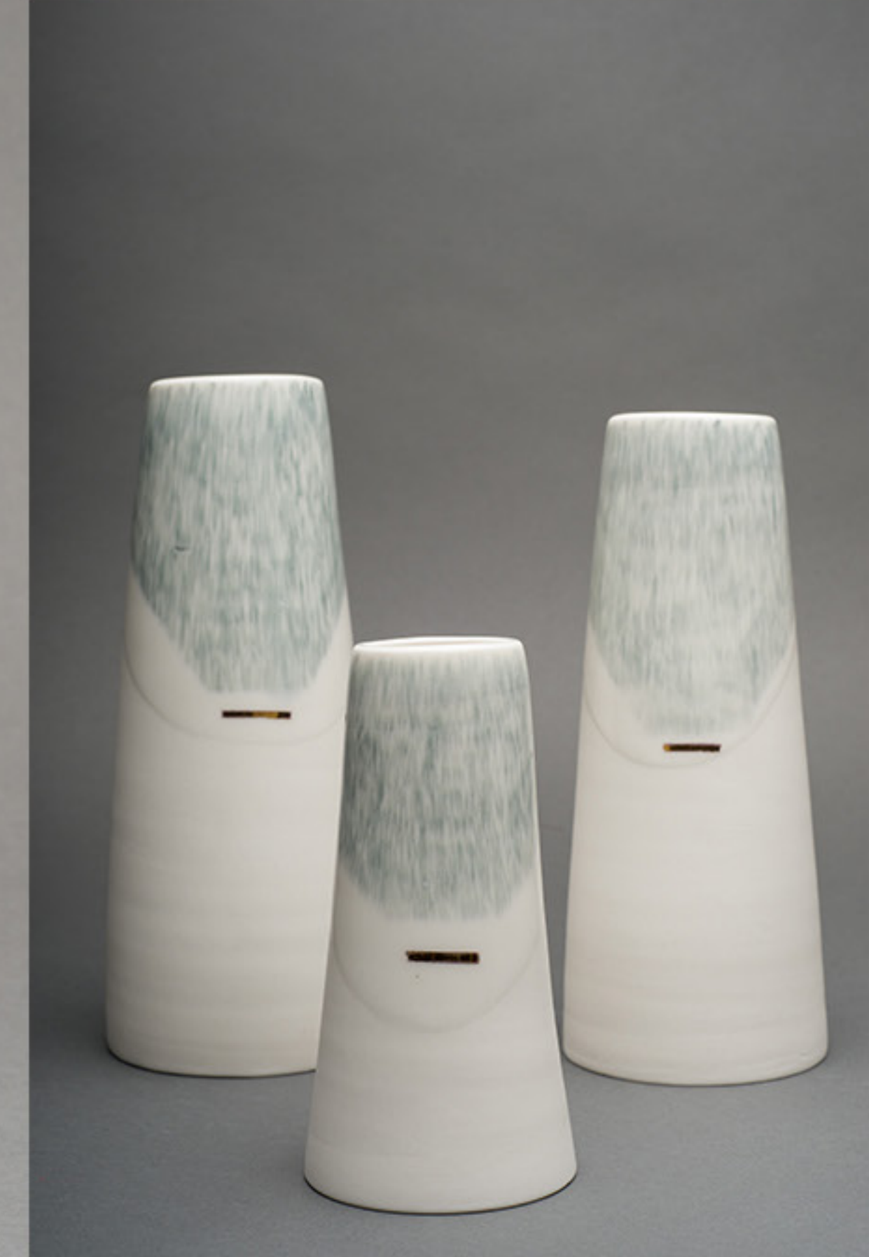
KATIA DANIELA RÍOS CAMPOS

Barro de alta temperatura; construcción manual en cuerdas. 20 x Ø 17 cm