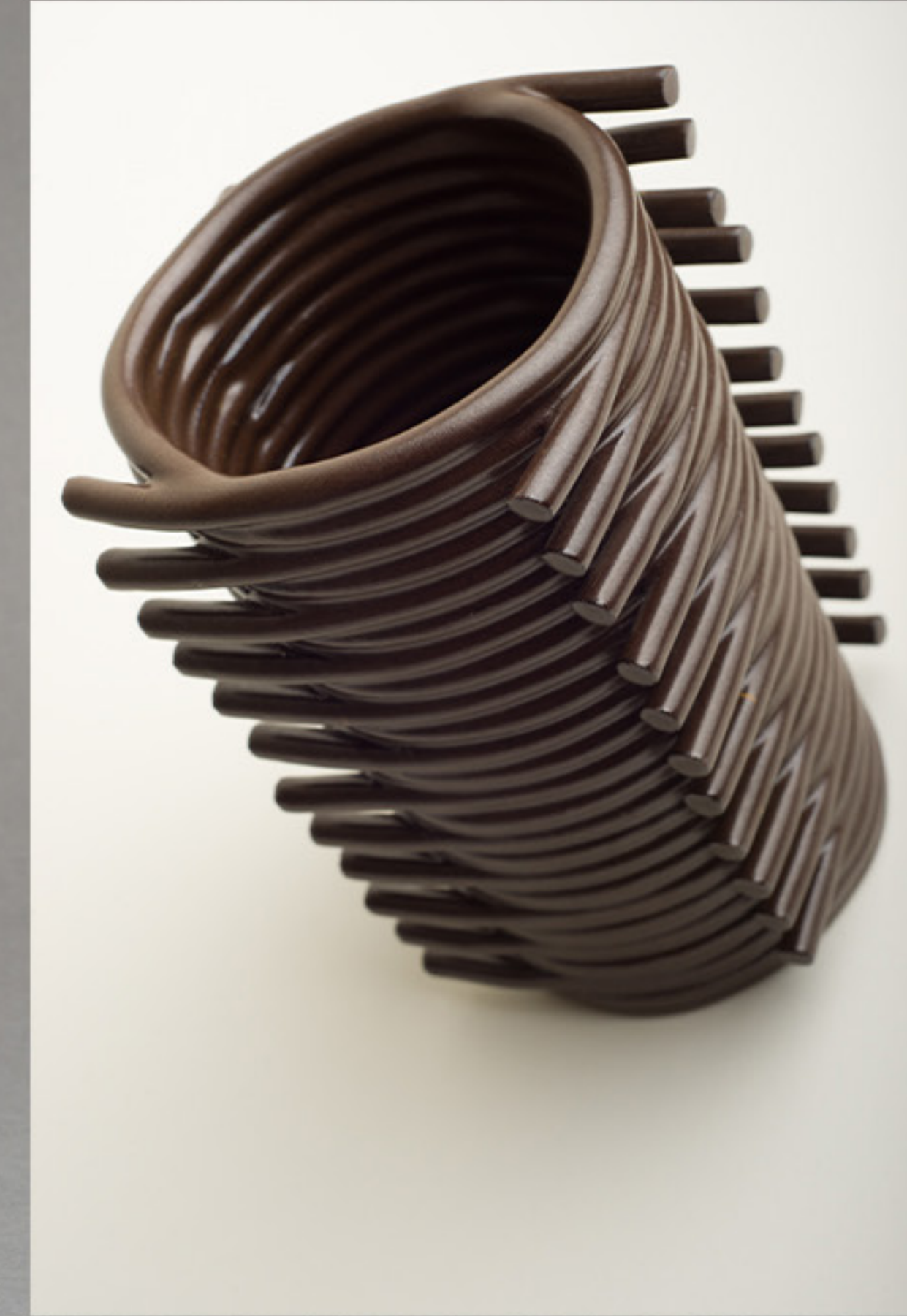
LAIA CUYAS BLANCO VERACRUZ

Tetas macetas Gres; pastillaje. 12 x Ø 16 cm (pieza más grande)